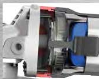
Brzda zastaví nástroj za 3,5 sekundy