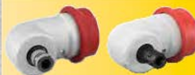
WV 10.8-EC Obj. číslo 442.372