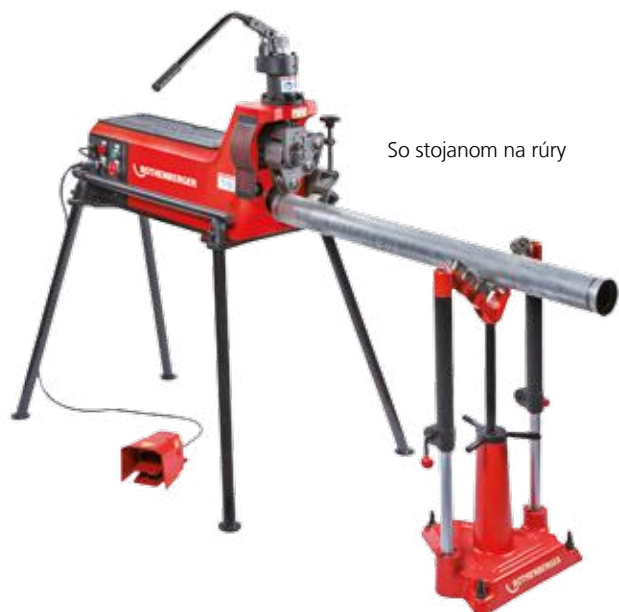
So stojanom na rúry

Elektrohydraulický drážkovač pre štandardné i tenkostenné ocelové rúry Ø 1-12" (33-324 mm). Prístroj vhodný pre výrobu normovaných drážok, má stabilnú konštrukciu, revolverovú hlavu a laserový zameriavač polohy.