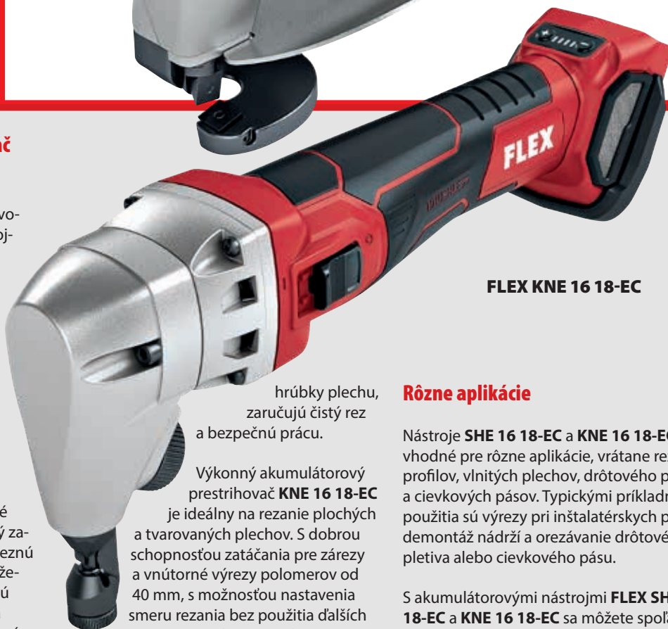
FLEX KNE 16 18-EC

hrúbky plechu, zaručujú čistý rez a bezpečnú prácu.