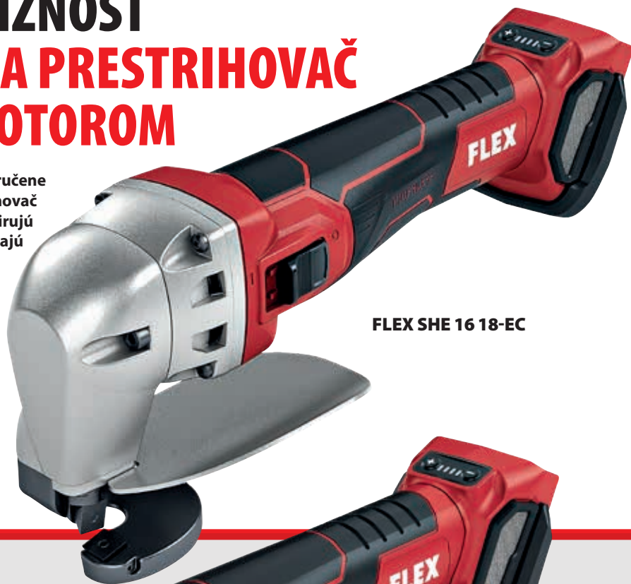
FLEX SHE 16 18-EC

SHE 16 18-EC sú praktickými a ľahko ovládateľnými akumulátorovými nožnicami na plech, ktoré zvládajú rezanie bez otrepov. S maximálnou schopnosťou zatáčania pre pohodlné rezanie malých polomerov od 15 mm a nastaviteľným rozsahom nožov pre rôzne